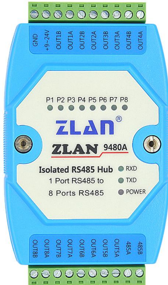
图 3 9480A 接口图