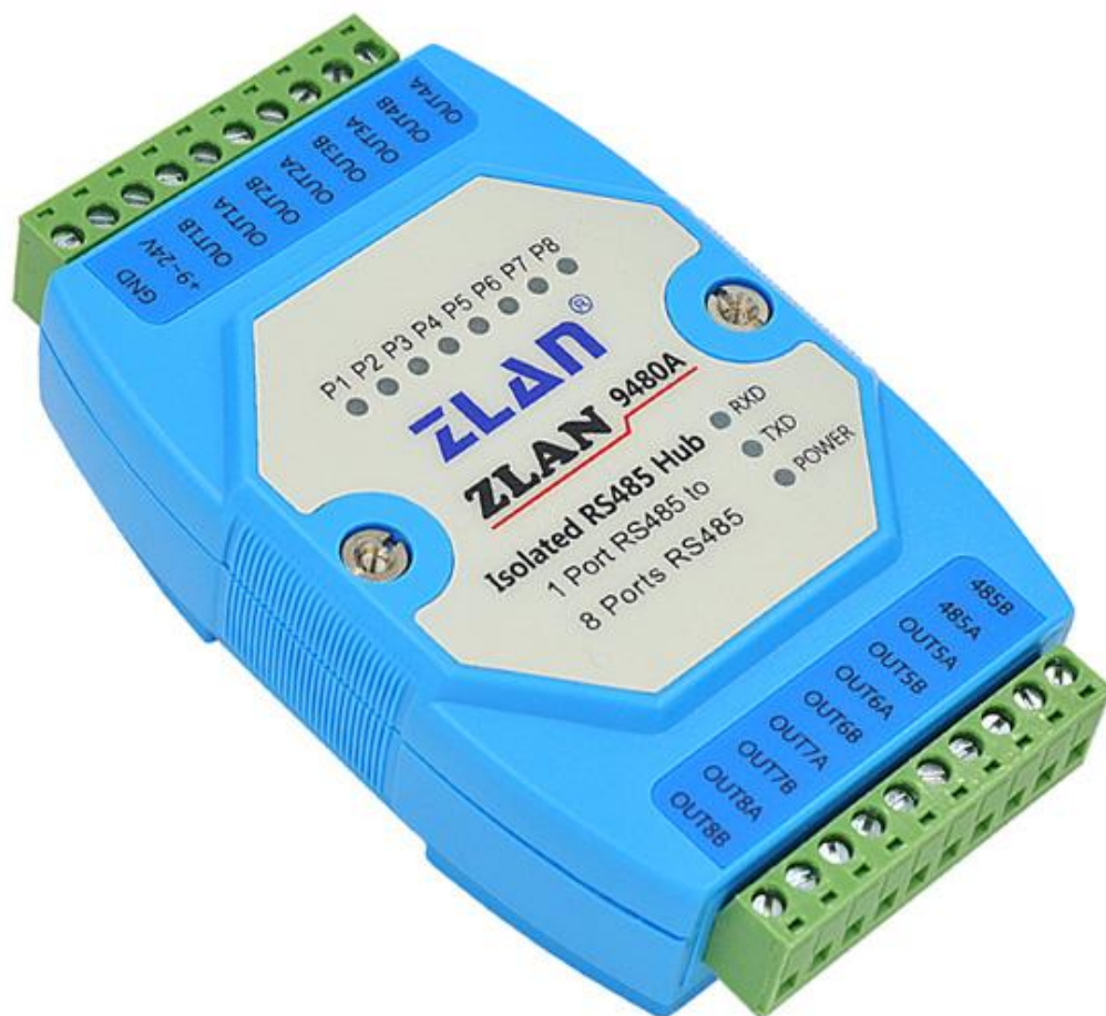
图 1 ZLAN9480A 外观

ZLAN9480A 是一款可通过一路 RS485 主口扩展出 8 路 RS485 从口的工业级隔离型 8 口 RS485 集线器。可以有效的实现 RS485 网络的中继、扩展与隔离。